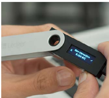
Ledger Nano S. Cartera de alta seguridad.