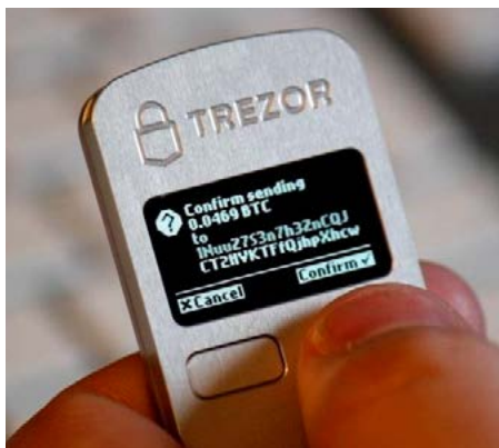
Trezor. Hardware para almacenar monedas digitales.